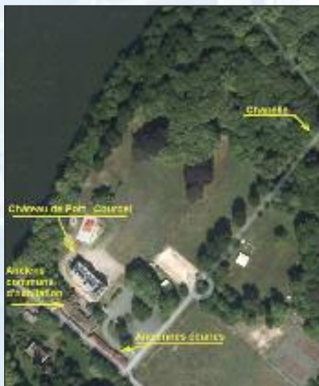
Vue aérienne de port Courcel en 2012.