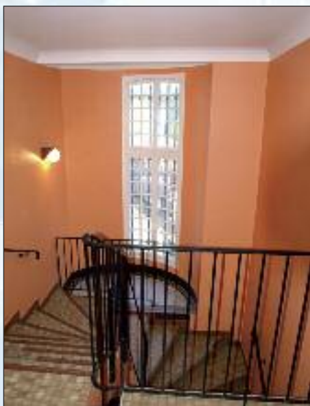
4 Vue intérieure de l'escalier en colimaçon avec son carrelage ancien.