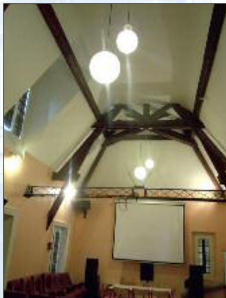
La salle de conférence a conservé ses poutres anciennes.