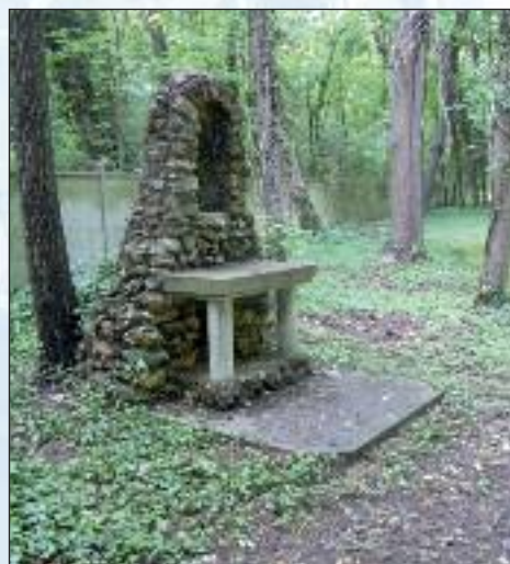
La chapelle au fond du parc.