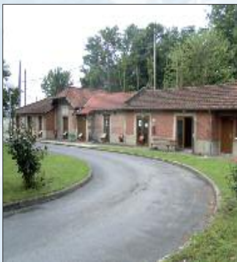
6 Les anciennes écuries.