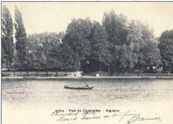
De tout temps, Port Courcel a constitué un lieu de passage de la Seine.

En 1858, le conseil municipal de Vigneux, donnant son avis sur l'étendue du port du bac de Port-Courcel, constatait: « L'urgence, pour rendre ce passage non seulement praticable, mais encore non dangereux, d'exécuter dans le plus bref délai possible les travaux [...] qui interceptent le passage et le