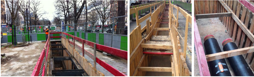
Exemple de chantier de chauffage urbain